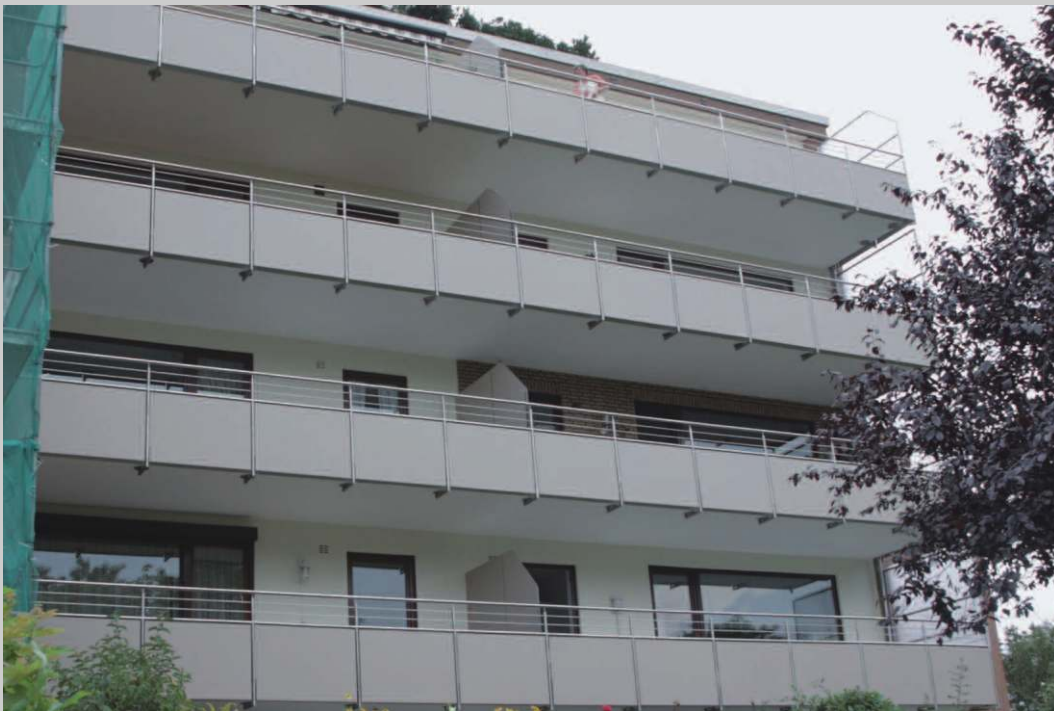
Entwurf: "qbus architektur" Edelstahlgeländer/Füllung mit Trespa