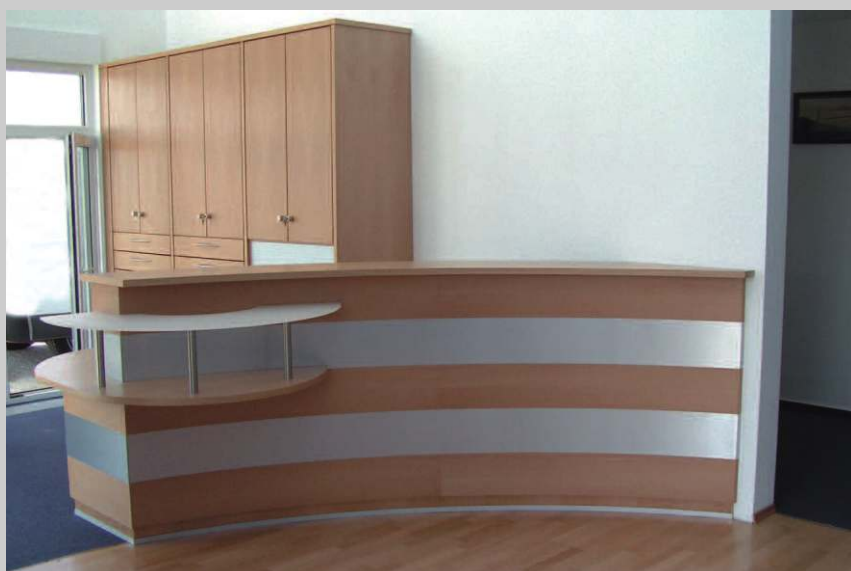
Empfangstresen mit Schrankwand Bürogebäude