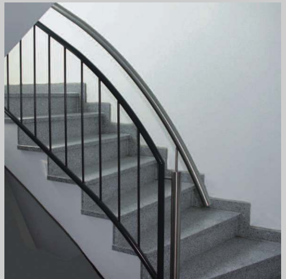
Innen-Trepengeländer Edelstahl und Stahl lackiert