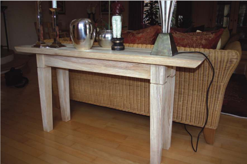
Beistelltisch aus Akazienholz