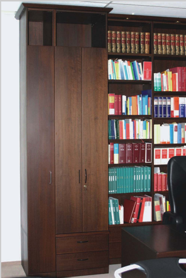
Schrankwand Anwaltskanzlei in Buchefurnier auf "Wenge" gebeizt