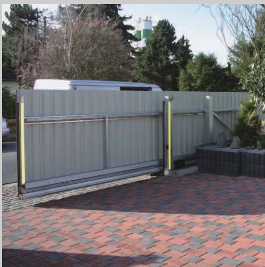
frei- tragende Schiebe- toranlage mit Zaun