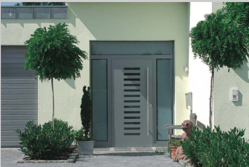
Aluminium-Haustür, flügelüberdeckend, pulverbeschichtet