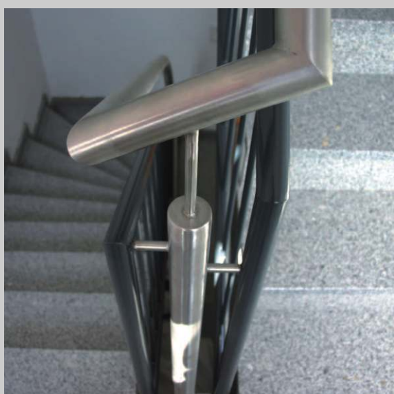
Pfosten verzinkt- Handlauf und Geländer in Edelstahl