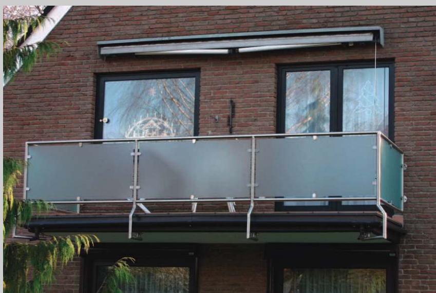
Edelstahl mit satiniertem Glas