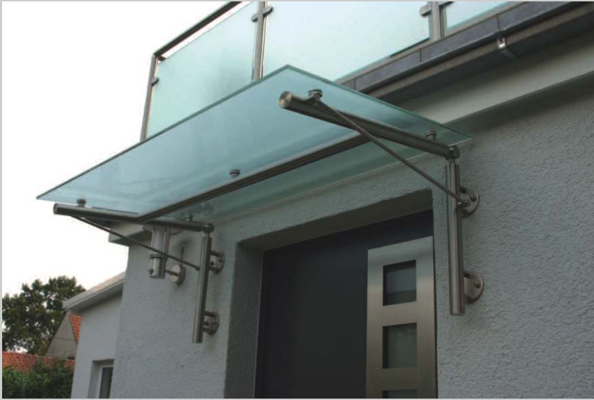
Edelstahl- Vordach mit Verbundsicher- heitsglas, satinert