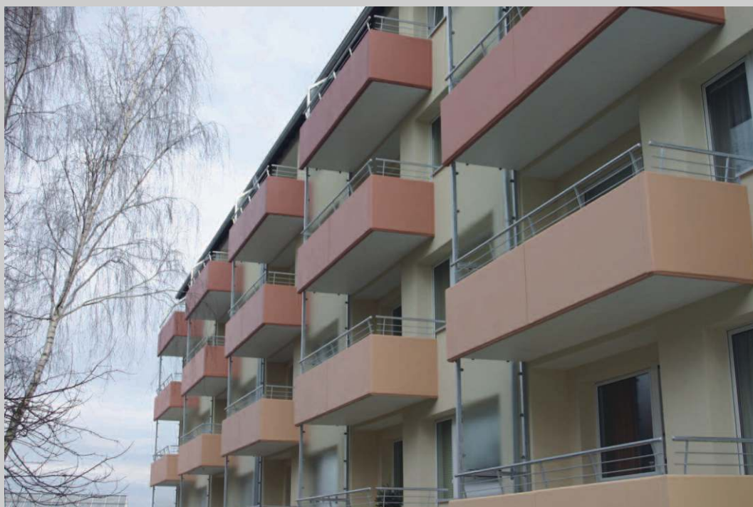
Entwurf: "qbus architektur"