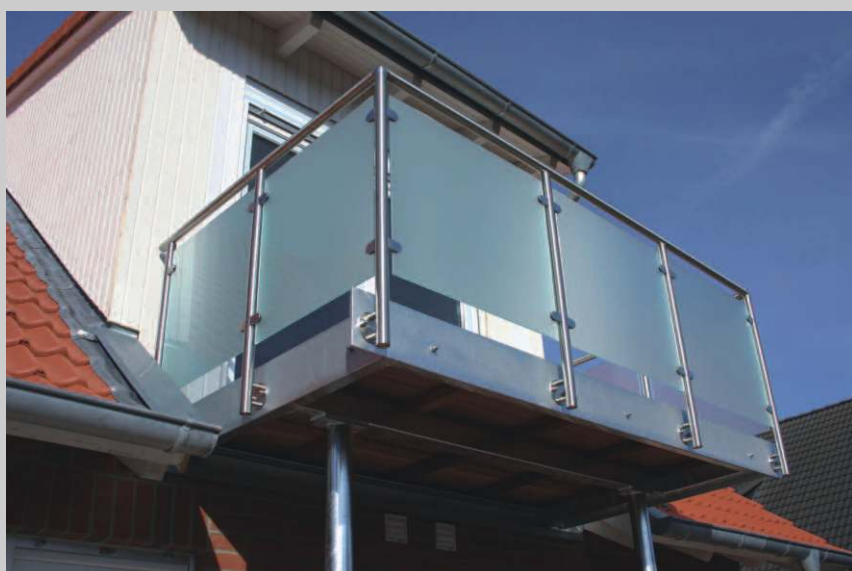
Edelstahl mit satiniertem Glas