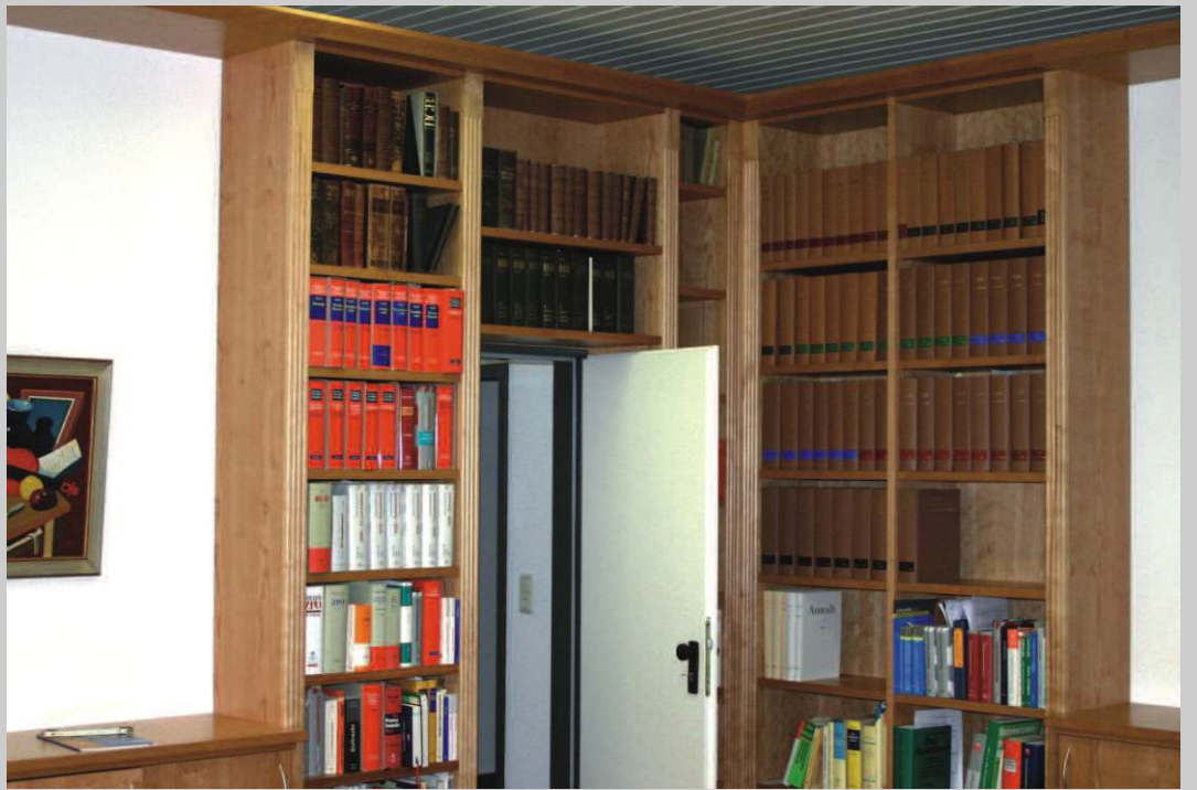
Bibliothek Anwaltskanzlei aus Kirsche-Furnier