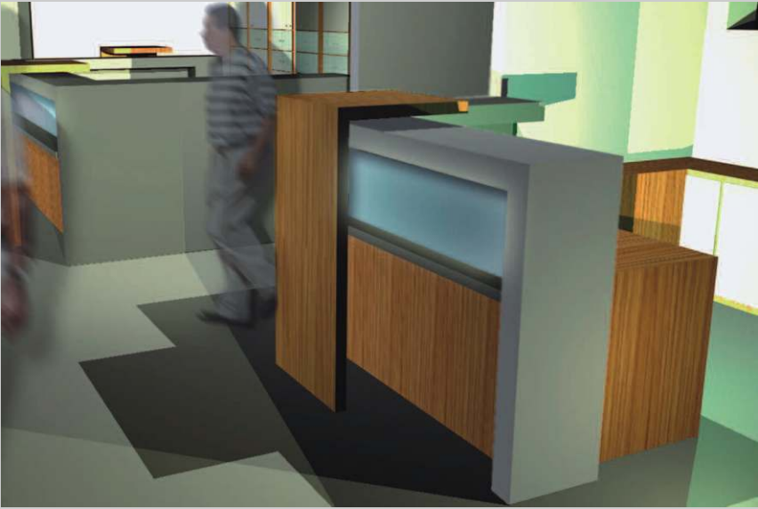
Empfangstresen Arztpraxis Entwurf CAD