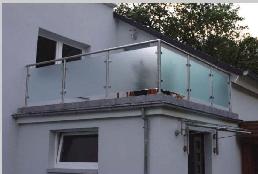
Edelstahl mit satiniertem Glas