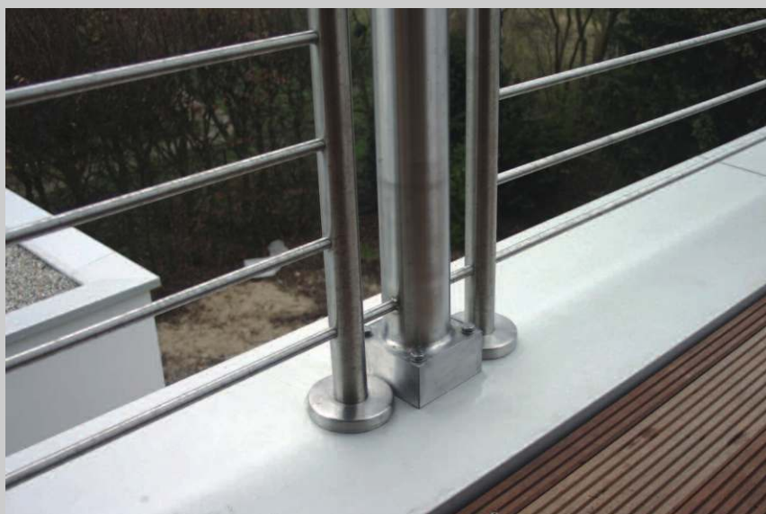
Pfosten in Edelstahl