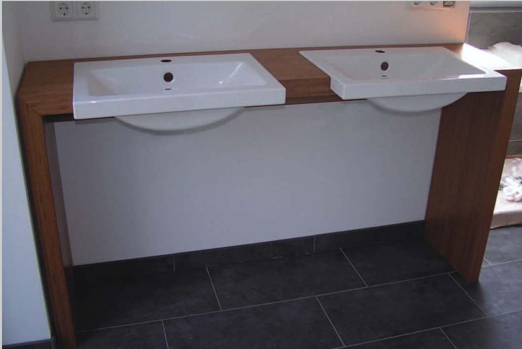
Waschtisch aus Bambus