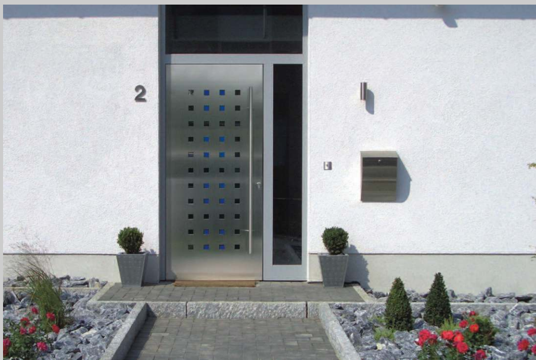
Aluminium-Haustüren mit Edelstahlfüllung, flügelüberdeckend