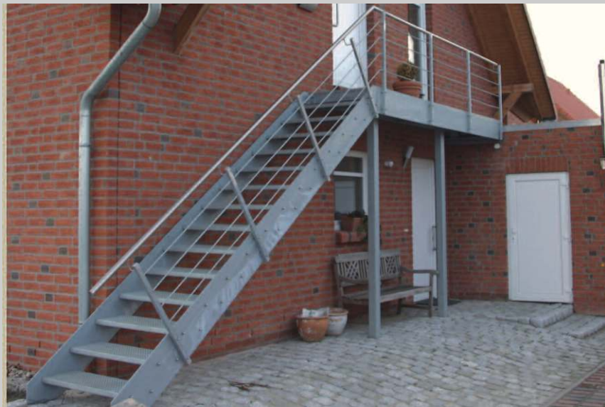
verzinkte Treppe mit Edelstahl- Handlauf