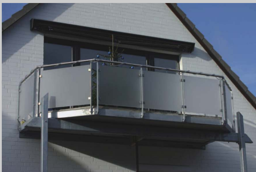
Verzinkte Unter- konstruktion mit Edelstahl-Geländer und Plexiglas "Frost" Füllung